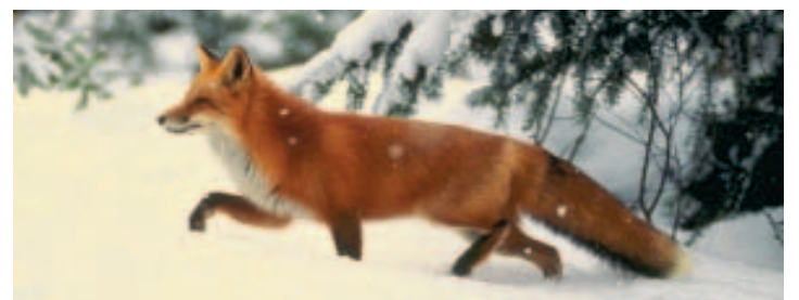
LA CAMPAGNE DE VACCINATION des renards avait porté ses fruits.

Cela change peu de choses à la vie, mais ça sonne quand même plus propre. Voici peu, la Belgique a retrouvé son statut de pays « indemne de rage ». L'organisation internationale de la santé animale (OIE), basée à Paris, a en effet signifié à notre pays qu'en l'absence de nouveau cas, il pouvait être considéré comme exempt de la maladie.