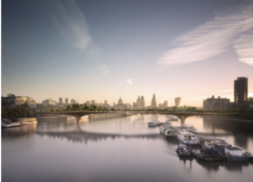
Image : A Londres, un jardin suspendu au dessus de la Tamise Image

des différents modes de transport. Les quartiers de la rive nord et le quartier historique de Temple sont presque complètement isolés de la rivière par la route à quatre voies présente sur Victoria Embankment. Waterloo Bridge est étonnamment hostile aux piétons...